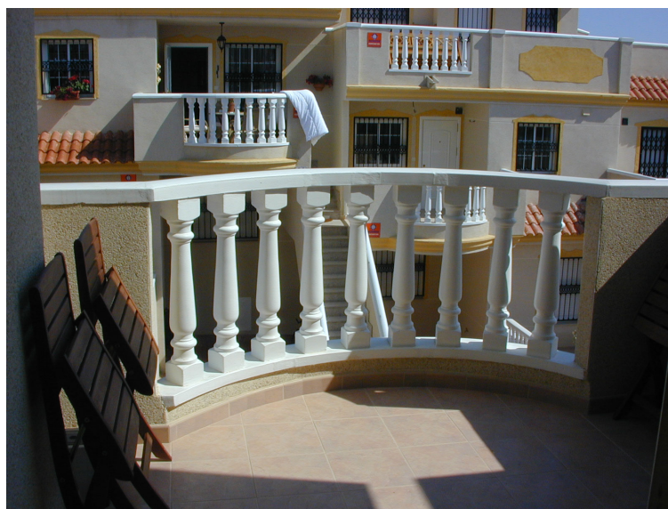
Bilde fra terrassen i 4 roms leiligheten

Du vil se nr. 12 i det første bygget og nr. 15 i det siste bygget, begge på venstre hånd.