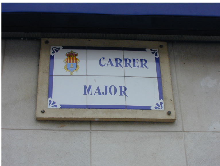
Hovedgaten i Guardamar

Dersom du kjører slik det er beskrevet i punkt 2 over kan du i rundkjøringen se skilt til Piinaar de Guardamar . Det er en skog som grenser til stranda og sanddyner. Her er det flott å sykle, nydelige strender, og litt mindre folk på sommeren enn det er langs strandpromenaden lenger inne i byen.