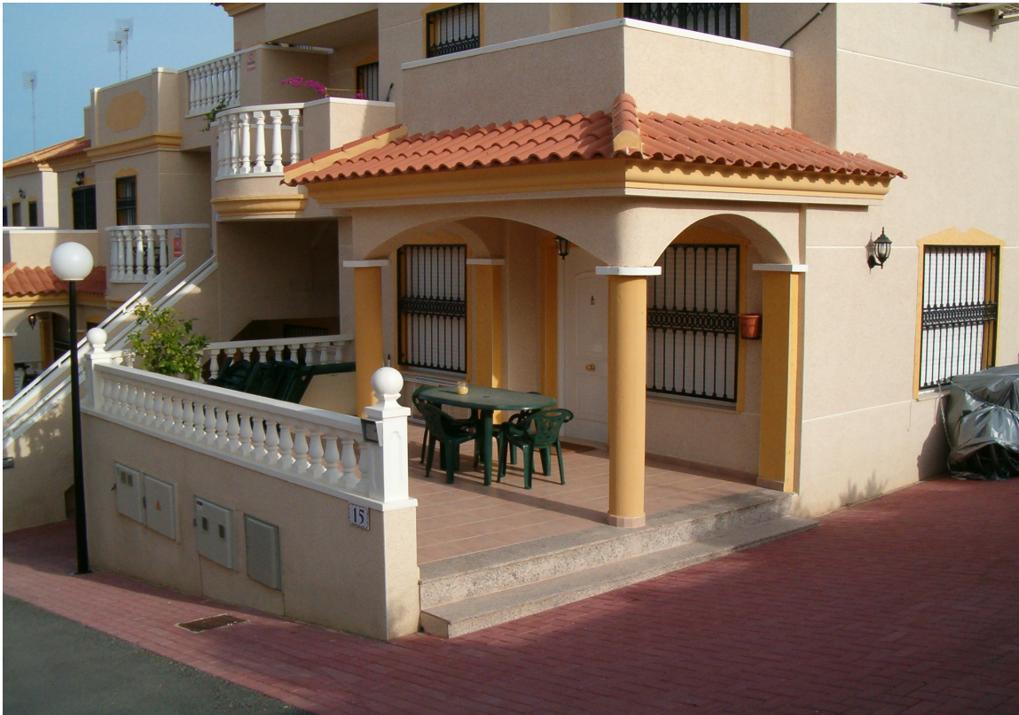
Bilde av 3 roms leilighet