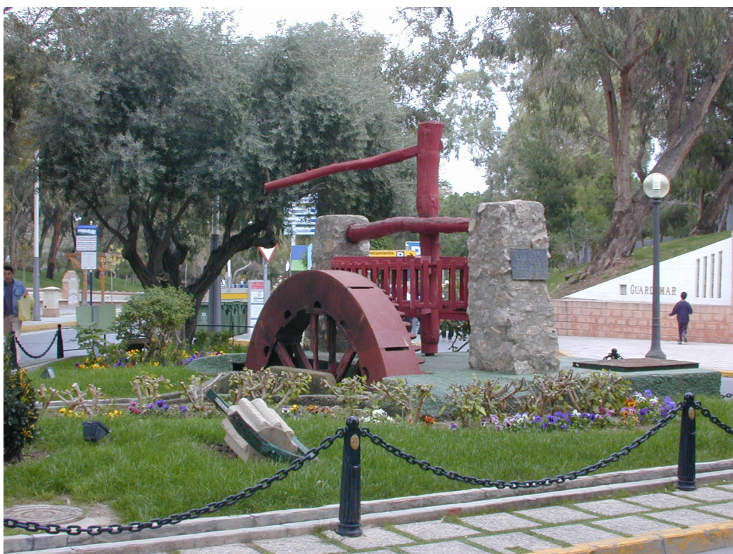
Gatebilde fra Guardamar

Du vil se nr. 12 i det første bygget og nr. 15 i det siste bygget, begge på venstre hånd.